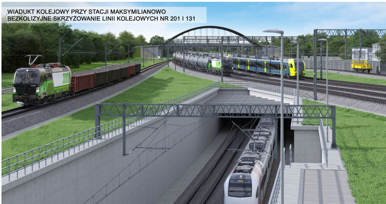
WIADUKT KOLEJOWY PRZY STACJI MAKSYMILIANOWO BEZKOLIZYJNE SKRZYŻOWANIE LINII KOLEJOWYCH NR 201 I 131